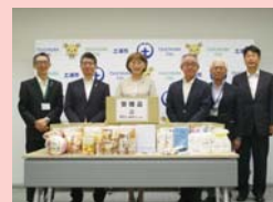
▲株式会社セブン-イレブン・ジャパン